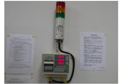
デマンドコントロール