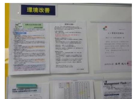
環境改善コーナー