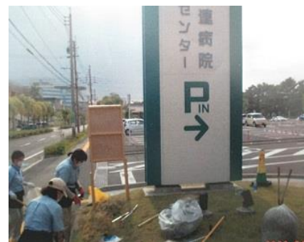
病院周辺の清掃活動

なお、病院や官公庁に関係する仕事なので、「SARS コロナウイルス抗原キット」を購入し、感染対策を徹底していました。