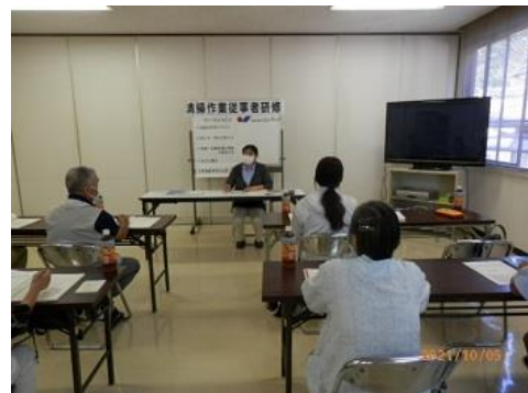
清掃作業従事者研修