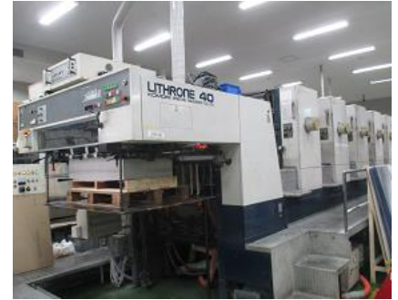
オフセット印刷機

＜主な業務内容＞ 印刷及び紙加工・紙器等の 製造、販売 ＜KES ステップ 2SR 登録日＞ 2018年6月1日