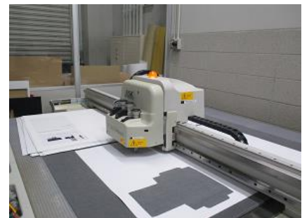
CAD サンプルカッター

そのため、環境目標としては 7 項目の CSR・SDGs 目標の設定が必須となっています。