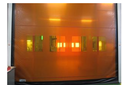
シートシャッター

環境配慮製品の提案を毎月 1 回目標とし、FSC 森林認証の取組みも推進しています。