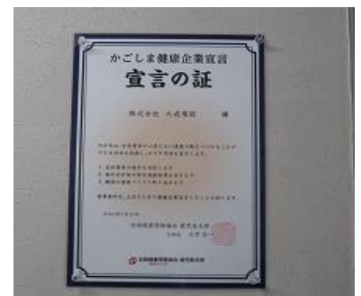
かごしま健康企業宣言

最近では、環境経営活動だけでなく ISO45001 労働安全衛生規格の認証取得や健康経営にも力を入れています。