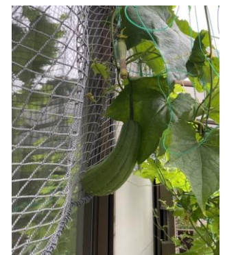
グリーンカーテン