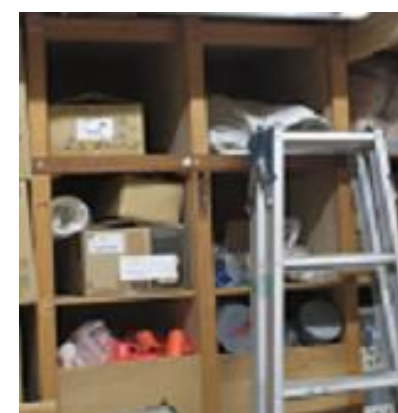
資材の整理・整頓