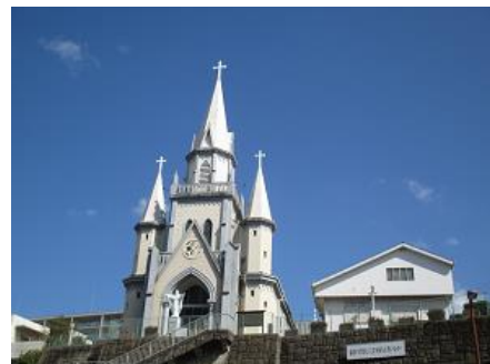
カトリック三浦町教会

＜主な業務内容＞ 電装機器・特機の 修理・販売・工事 ＜KES ステップ1 登録日＞ 2010年10月