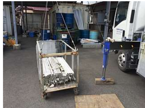
廃蛍光管の収集運搬・処理

＜主な業務内容＞ 産業廃棄物処理業 ＜KES ステップ1 登録日＞ 2019年3月