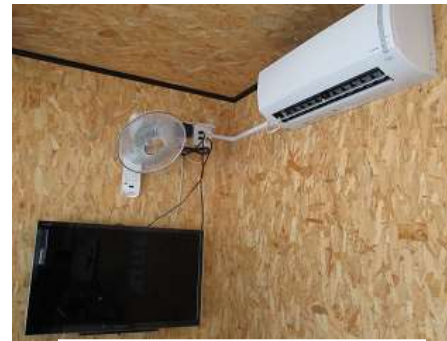
エアコンと扇風機の併用

壁付けしているテレビはネットにもつなぐことができ、テレビ会議・教育にも使えます。