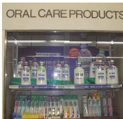
オーラルケア商品