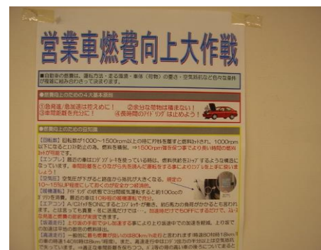
営業車燃費向上大作戦