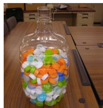
エコキャップ活動

そのため、国内4工場ではISO14001を、各地の事務所・オフィスではKESを取得して、全社的に環境活動を展開しています。