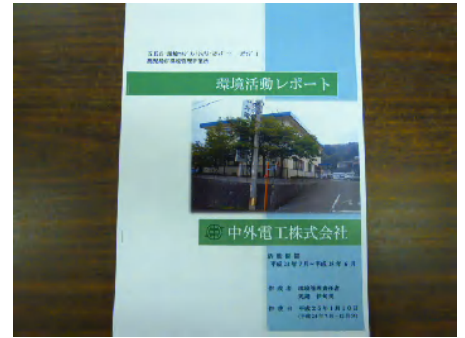
環境活動レポート

拝見いたしましたが、とても見やすく、今後冊子の厚みが増していく事が楽しみなレポートです。