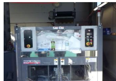
発泡スチロール加工機