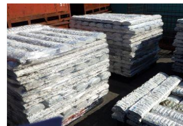
発泡スチロールインゴッド