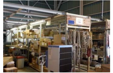
「資材・機材整理整頓」

工場内では、機材・資材の整理整頓を推進し、ボロ切れ等は船内清掃用に再利用し、産業廃棄物リサイクル率は99.9%です。