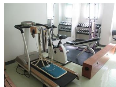
トレーニングルーム