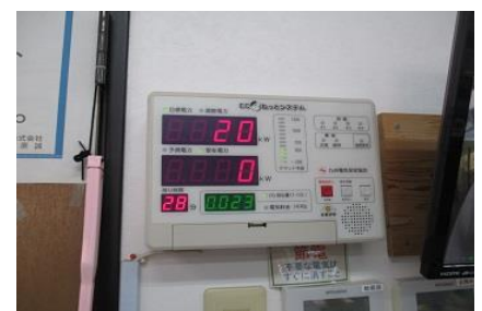
デマンドコントロール