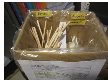
使い捨て製品使用の集計ボックス

成約に至るまで時間はかかりますが、提案の継続で磨きをかけノウハウを蓄積しています。