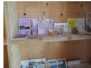
レンタルスペース 「ギャラリー カエキマエ」

様々なクリエイターがチャレンジショップとして利用する等、交流の場や個々の能力を発揮できる場になっています。