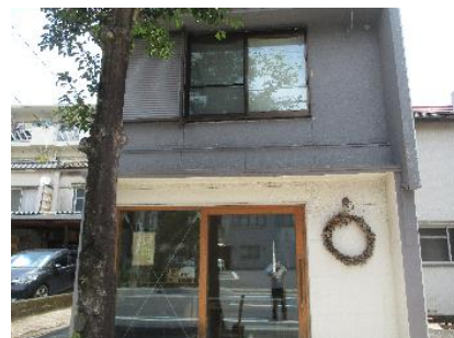
レンタルスペース 「ギャラリー カエキマエ」

今回お邪魔したのは、鹿児島市柳町1丁目にある トラス・アーキテクト株式会社 です。 JR鹿児島駅を北側に出て1分の場所にあります。