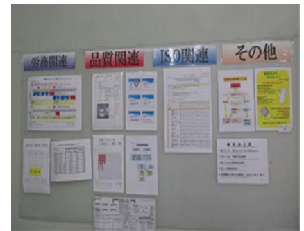
環境・品質情報の掲示板