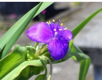
ムラサキツユクサ