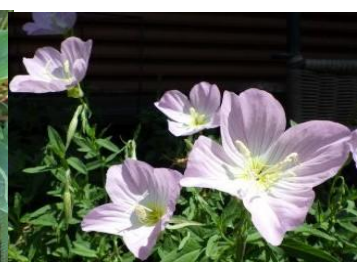
ヒルザキツキミソウ