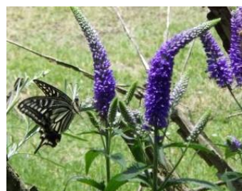
ルリトラノオと蝶