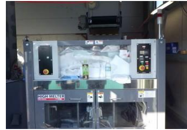
発泡スチロール加工機

④顧客へ自社開発の電子マニフェストシステムを提供し、電子マニフェスト化70%を達成しています（一般的には10%程度）