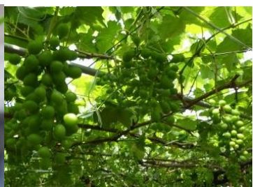
シャインマスカットの実