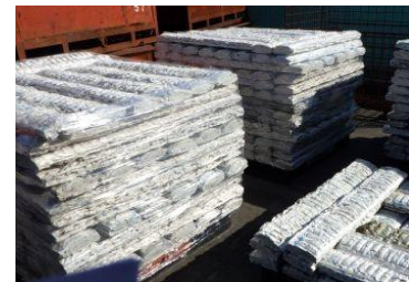
発泡スチロールインゴッド

数年前から一人1台のタブレットを持ち、システム（牛若丸）により最適なルートで無駄のない走りができるようになっています。