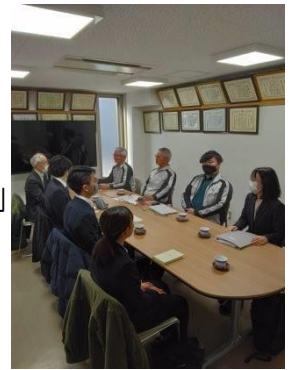
環境経営会社訪問

その時の受講者の感想・反応から、もっとそのような講座を増やすべきと思いましたが、その後チャンスがなくそのままになっていました。