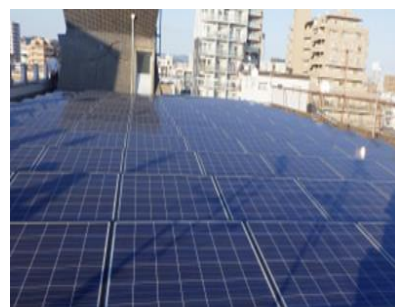
自社ビルの太陽光発電

事務所の電灯は全てLED照明、窓は「Low-E 複層ガラス」を使用、節水型トイレと人感センサーに更新しています。