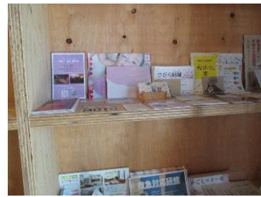
レンタルスペース 「ギャラリー カエキマエ」

様々なクリエイターがチャレンジショップとして利用する等、交流の場や個々の能力を発揮できる場になっています。