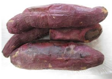
サツマイモ (紅はるか)