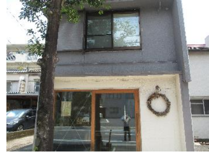
レンタルスペース 「ギャラリー カエキマエ」

今回お邪魔したのは、鹿児島市柳町1丁目にある トラス・アーキテクト株式会社 です。 JR鹿児島駅を北側に出て1分の場所にあります。