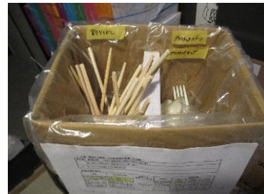
使い捨て製品使用の集計ボックス

成約に至るまで時間はかかりますが、提案の継続で磨きをかけノウハウを蓄積しています。