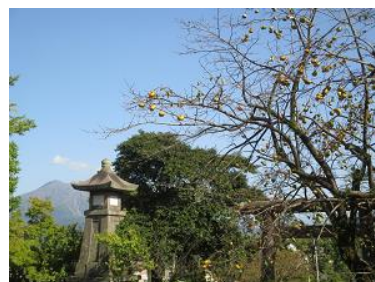
南洲神社の柿の木