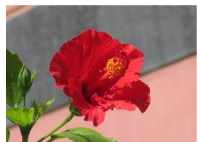
沖縄のハイビスカス