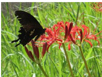
ヒガンバナとクロアゲハ