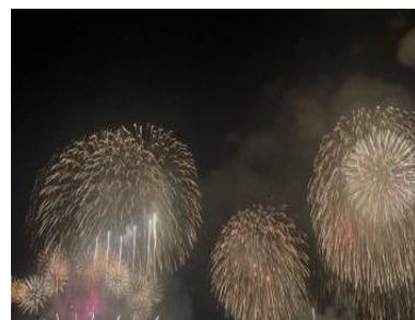
サマーナイト大花火大会