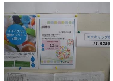
エコキャップ収集活動