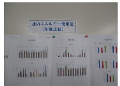
エネルギー使用量推移グラフ