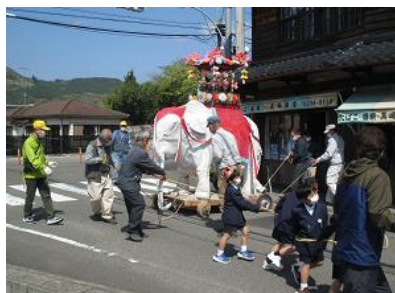
玄徳寺の花まつり