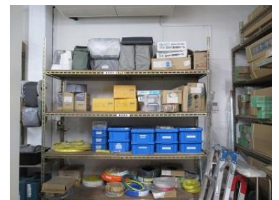
材料・部品管理棚