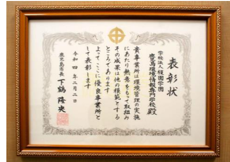
優良事業所の賞状

今回お邪魔したのは、鹿児島市田上にある学校法人榎園学園鹿児島環境・情報専門学校です。 今年2月に令和3年度の グリーンオフィスかごしまの優良事業所 として表彰されました。 平成26年に、九州で唯一の環境専門学校として創設しています。