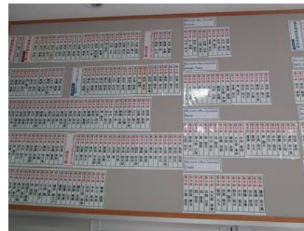
資格取得者の掲示

環境目標としては「電気使用量の削減」を掲げていますが、学校では環境教育、生物多様性等に取り組んでいます。