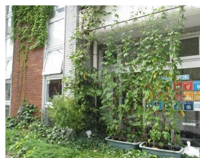
グリーンカーテン