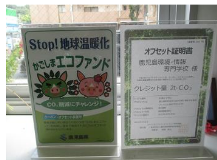
カーボンオフセット証明書