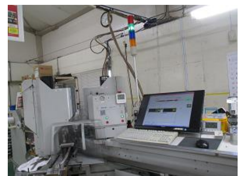
画像処理検査設備