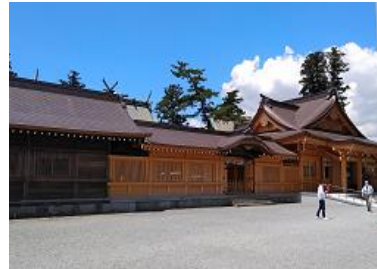
再建された阿蘇神社