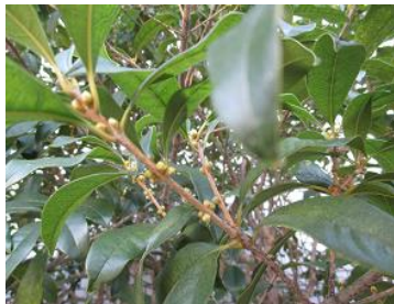
キンモクセイのツボミ