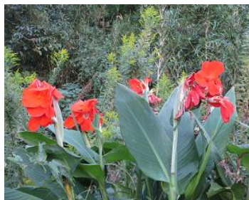
何回も咲くカンナ