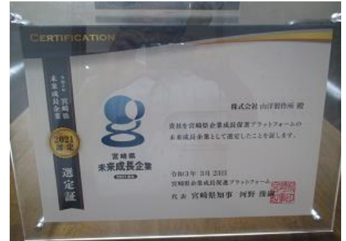
宮崎県未来成長企業選定証

＜主な業務内容＞ ワイヤーハーネス加工・組立 電装部品加工・組立 ＜KES ステップ2登録日＞ 2012年11月