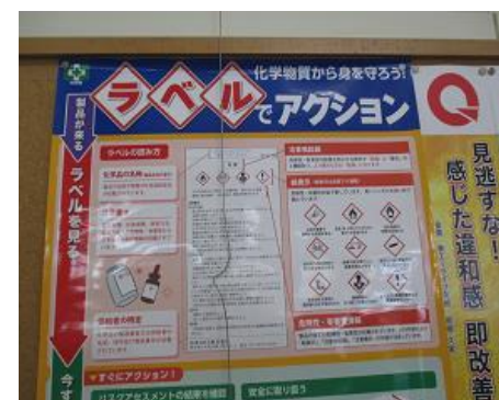
化学物質ラベルアクション