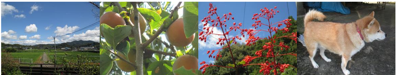
「 おばんずカフェ 」からの風景