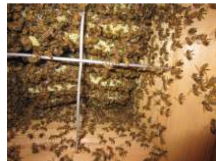
木箱のミツバチの様子