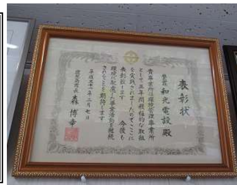
環境管理優良事業所の表彰