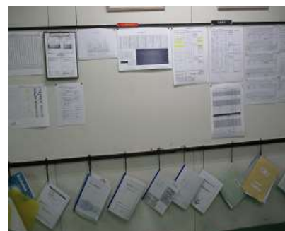
品質・安全・環境掲示板