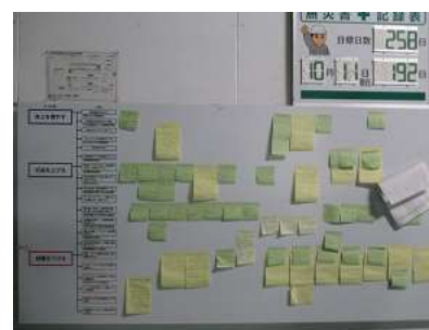
経営改善アイデアの掲示