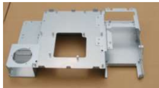
製品事例:アッセンブリ(シャーシ)