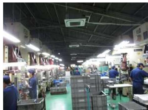
プレス工程ライン

＜主な業務内容＞ 金属プレス部品 及び金型の製造販売 ＜KES ステップ2登録日＞ 2006年10月