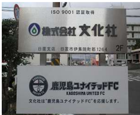
地域のサッカーチームを支援