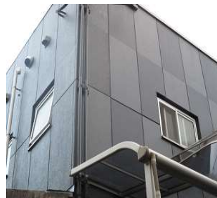
屋根と壁に遮熱処理