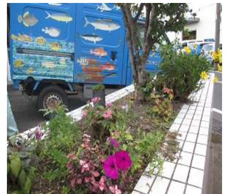
生物多様性と魚が描かれた車

また、雨水を活用するために屋根からの雨水管と3トンのタンクをつなぎ貯留しています。