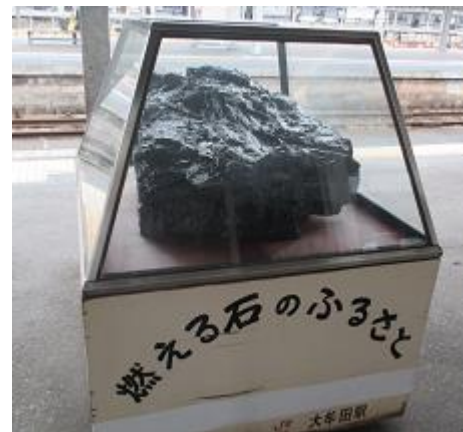
JR 大牟田駅構内 石炭の展示