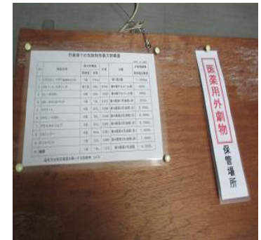
化学物質保管の表示

化学物質保管庫も在庫数・置き方等を明確にし、管理しています。そして、毎月一回設備・化学物質の管理状況を確認していますが、さらに工場責任者が毎週一回、抜き取りチェックをしていました。