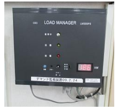
デマンドコントロール

省エネ活動の推進とあわせて、工場にはデマンドコントロールを導入し、設備の立上げ時間の調整や優先切断対象機器等を明確にすること等により、電力ピーク値を順次下げてきています。