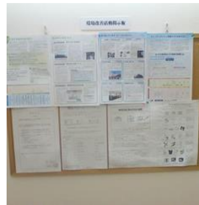
環境改善活動掲示板

これまでの改善施策としては、屋上へのソーラー25kW の設置、自動販売機の1台撤去と省エネ型（電気のピークシフト、魔法瓶型等）への更新、化学物質の適切な発注・在庫管理、廃油タンクの漏れ対策としてオイルフェンスの設置、自己評価員の養成などがあります。