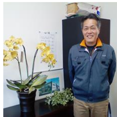
矢野社長・環境管理責任者