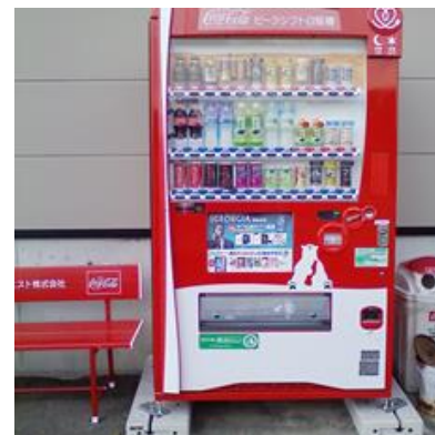
省エネ型自動販売機