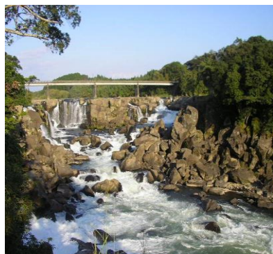
伊佐市にある曾木の滝