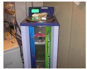
アルカリイオン水 製造装置

最近では、社員の提案でトイレにバイオ洗剤を使用するようにしており、尿石がつきにくく、清掃周期も延ばせるとのことです。