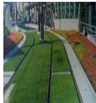
鹿児島市電軌道敷

用途に応じた芝を使用することで、余計な薬品や機械の燃料等を使わないため環境にも優しく、そして管理もしやすく一石二鳥になるとのことでした。