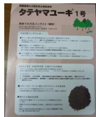
タテヤマユーク 1号

有村総合建設で扱われている、グリーン購入認定商品で発酵下水汚泥コンポストの「タテヤマユーク 1号」があります。この様な環境に配慮した商品販売の促進に KES システムを用いて展開していきたいとのことでした。