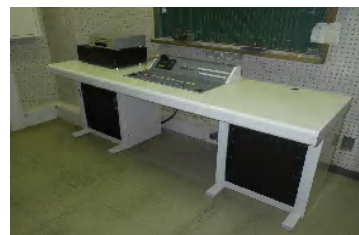
某高校の放送システム

情報・工事関連の各資格者がおり「小回りがきく」ことが『会社の強み』とのことでした。