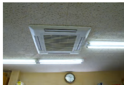
インバータ式空調