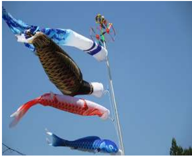
元気に泳ぐ鯉のぼり