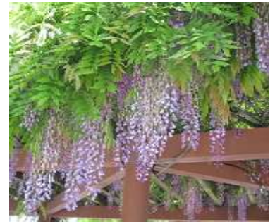
かごしま環境未来館のフジ