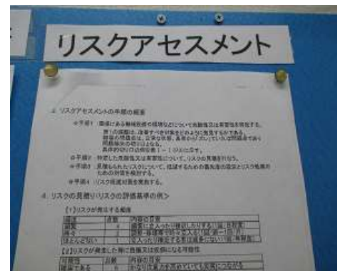
リスクアセスメント