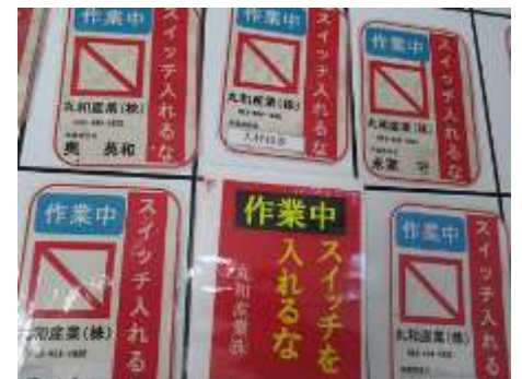
安全作業用表示板