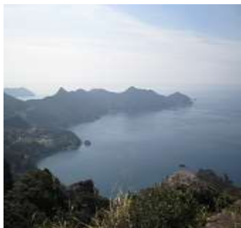
鑑真和上漂着の坊津港