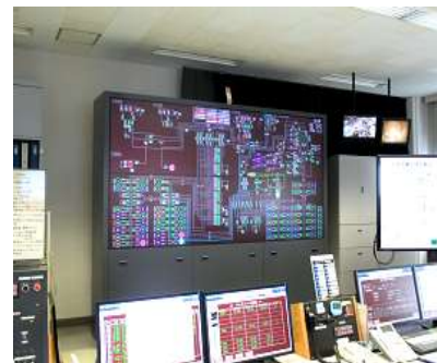
中央コントロール室

デジタル温度計で室内温度を見える化し、定期的に、電気使用量の状況を全社員に周知しています。