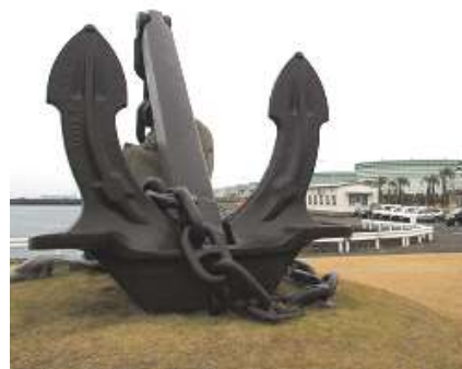
日石丸のアンカーと会社全望

今回お邪魔したのは、鹿児島市喜入中名町にある JX 喜入石油基地株式会社 です。