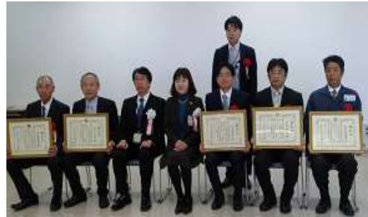
表彰の優良事業所

タンカータンク排出ガス処理、5段階の排水処理、定期的な防災訓練の実施とLEDの順次導入、各人の紙削減目標と実践また地域貢献として海岸清掃・夏休み科学バスツアー・3カ月に一回の環境・安全新聞の発行などを推進しています。