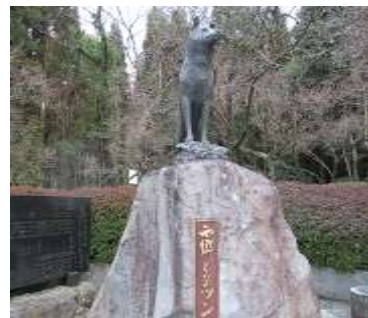
藤川天神のツン (西郷どんの愛犬)