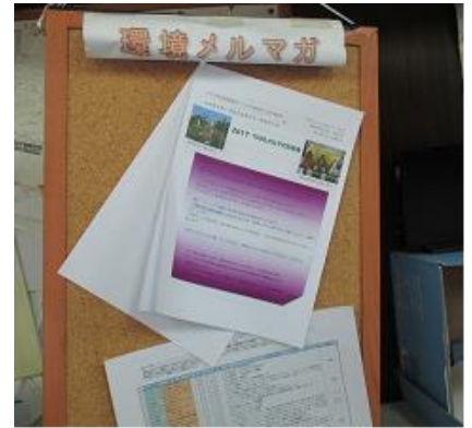
環境メルマガコーナー