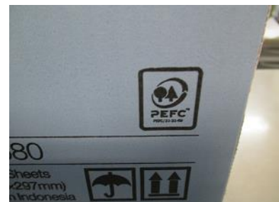
森林認証コピー紙

そこで、傷んでも買い替えやすい様に百均ですだれを購入しています。 なお、再生紙は白色だと値段が高くなりますが、お買い得な森林認証 ( PEFC ) 紙をネットで探し、定期的に購入しています。