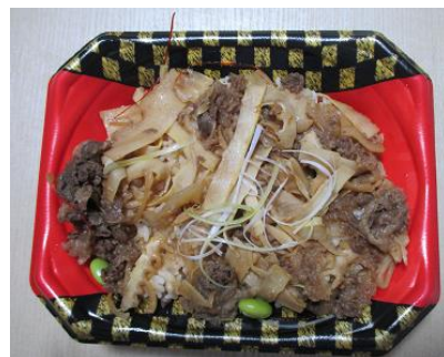
黒毛和牛たけのこ丼