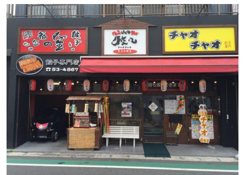
チャオチャオ餃子奄美井根店