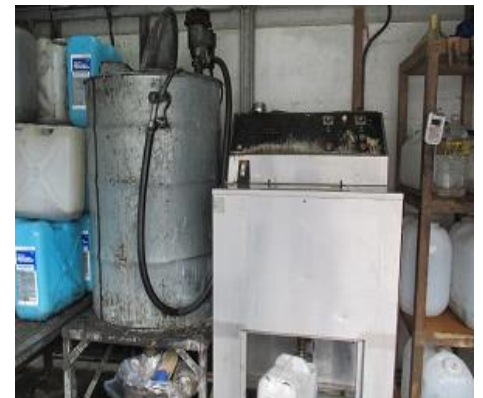
廃食油のバイオディゼル化