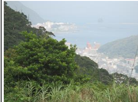
工場から望む奄美市街地