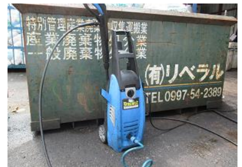
高圧ジェット洗浄機