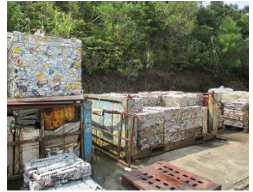
一般廃棄物の減容化