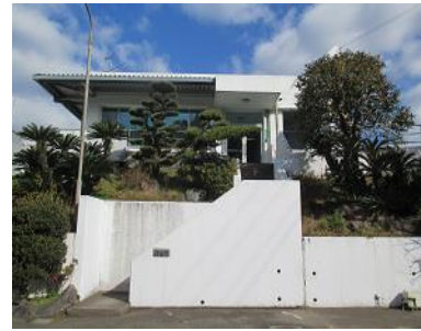
「半」地下構造の工場

また、有害物質や環境に影響を与える物質について、より安全性の高い物質への転換検討や、使用せざるをえない場合は、使用量の削減を図っています。