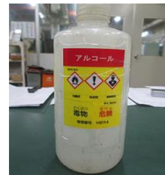
アルコールのラベル管理