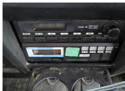
デジタルタコメーター