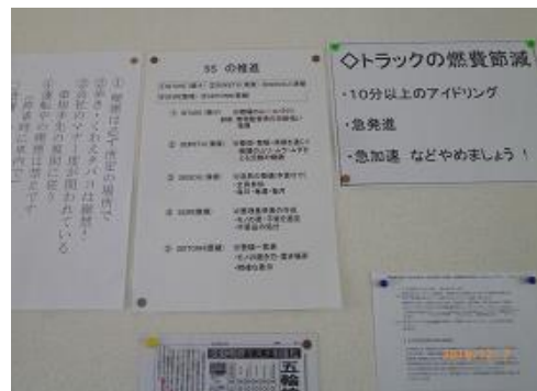
環境・安全掲示板