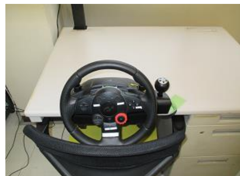
適性診断システム