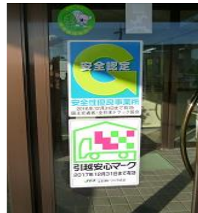
引越安心マーク等

引越し事業では、引越専用の車があり個人から事業所まで幅広く依頼を受けており、好評を得ています。