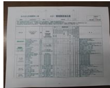
工事毎の環境側面抽出

⑥地域清掃・・・地域の敬老会と一緒に清掃を月に1回実施しており、地域の方に感謝されています。