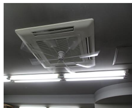
ハイブリッドファン

企業理念では「チャレンジ精神と感謝の気持ちを持ち続け、地域社会に貢献する誇りある企業を目指す」と謳い、「作業効率を向上させ、環境負荷の低減や省エネルギーに貢献する」ことを環境方針・目標に掲げています。環境に取り組むことが本業にもプラスになると、環境配慮経営をスタートしています。