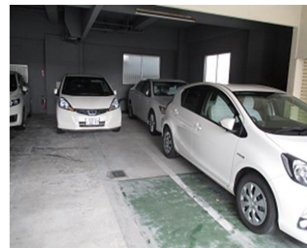
環境配慮の社用車