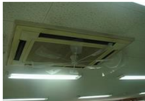
ハイブリッドファン

昨年 4 月 1 日からは(株)ナンワエナジーと大規模太陽光発電による電気需給契約を結ばれました。その自然エネルギーで、社内の使用するエネルギーを 100%まかない CO 2 排出量削減に貢献しています。