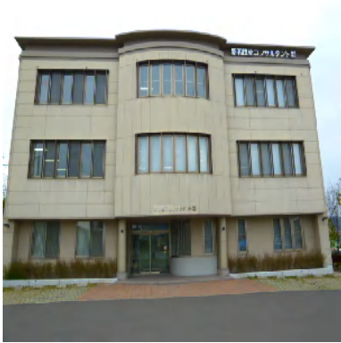
(薩摩川内市にある事業本部)

<主な業務内容> 建設コンサルタント、補償コンサルタント、測量業、1級建築士事務所・電気通信事業 ISO14001 登録日 2000年10月20日