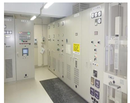
上水道施設電気計装設備

上下水道監視ネットワーク「TRUST」は、24時間365日専門的知識を持った監視員が常時監視を行い、お客様の設備サポートを行っています。鹿児島県の自治体の約7割、九州ほぼ全域、秋田、新潟、千葉、兵庫等全国的に多くの導入実績があります。