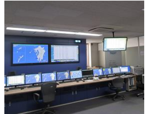
上下水道監視ネットワーク「TRUST」