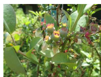
ブルーベリーの花と実