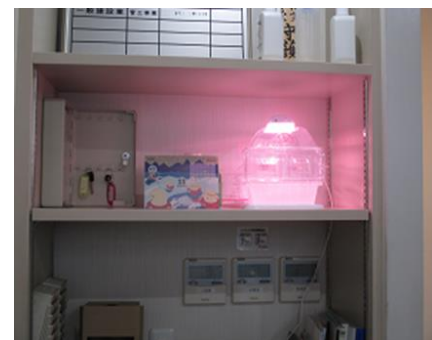
エコガーデン（水耕栽培）

「今は何を作っているのですか?」、「これは何の葉っぱですか?」と社員から質問がある等、食べられるものを育てて、食べることによって、農業・販売の大変さを考え、生物多様性・自然保護を考える良い環境教育になっています。