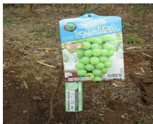
マスカットの植樹