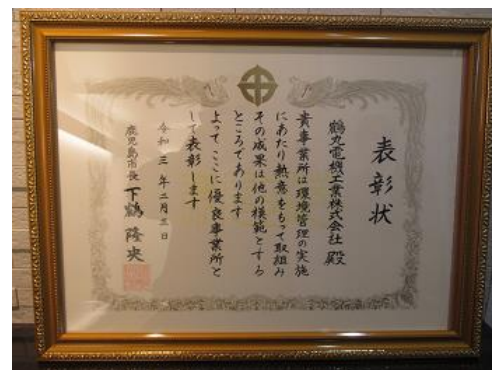
優良事業所表彰状