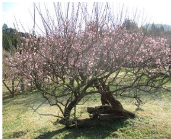
藤川天神の臥竜梅