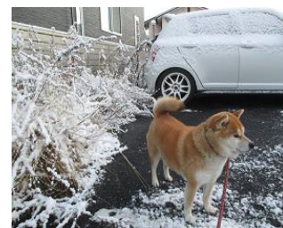
雪の中の柴犬・蘭