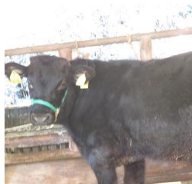
おやまんくちの牛