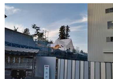
修復中の阿蘇神社