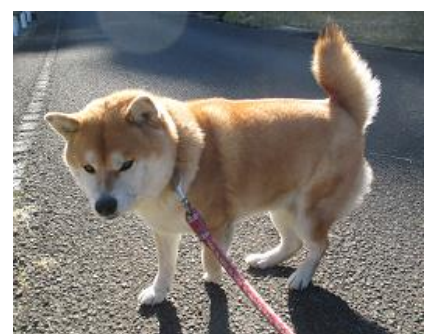
本年もよろしくお祈りします