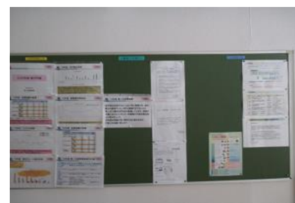
品質・環境掲示板