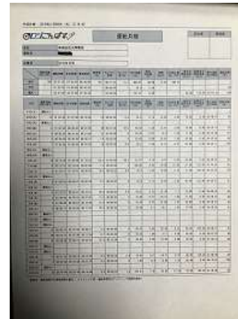
「ロジこんぱす」月報