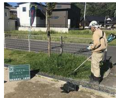
ボランティア清掃②