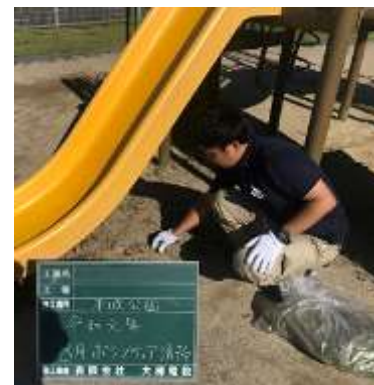
ボランティア清掃①