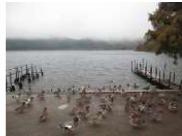
蘭牟田池の鴨と白鳥