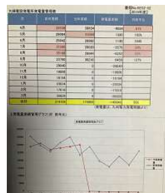
太陽光発電量グラフ

発電量が極端に少ない時があれば、社内で原因を分析し、社長自らが志布志まで行き、確認作業を行う等リアルタイムで管理しています。