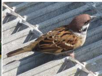
海釣り公園の子雀