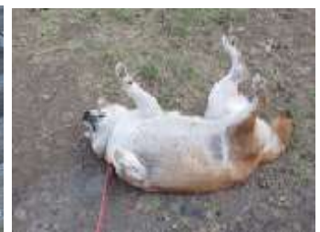
金魚運動する柴犬