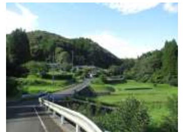
おやまんくちの風景