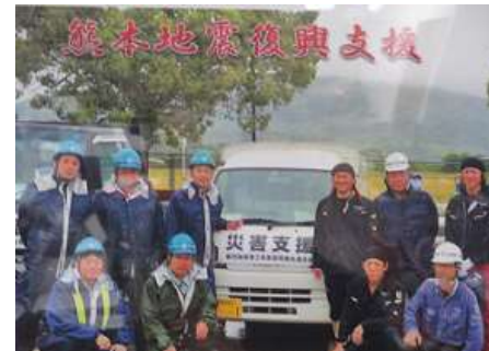
熊本地震復興支援