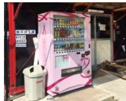
ピンクリボン自動販売機の設置