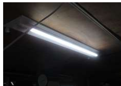
センサー付き LED の設置