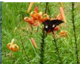
鬼ユリとクロアゲハ