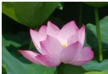
鶴丸城お堀の蓮の花