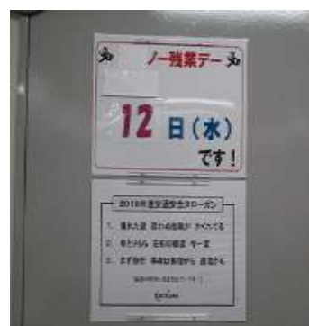
ノー残業デー掲示