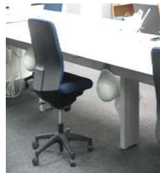
緊急事態対応・ヘルメット