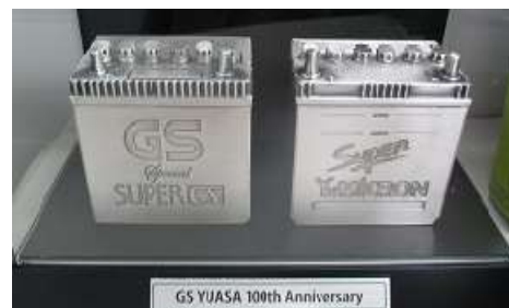
GSとユアサのバッテリーレプリカ

＜主な業務内容＞ 自動車用バッテリーまた カーナビ等電装品の卸販売 ＜KES ステップ2登録日＞ 2010年1月