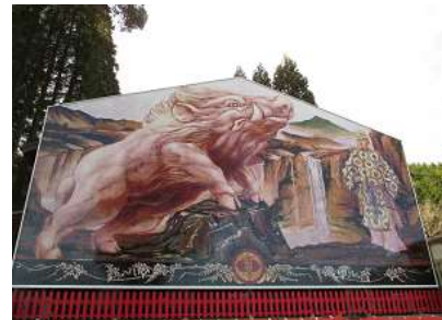
和気神社の特大絵馬