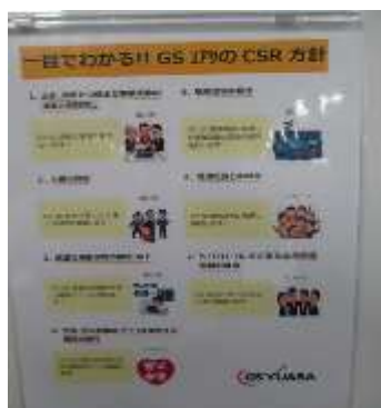
一目でわかるCSR方針