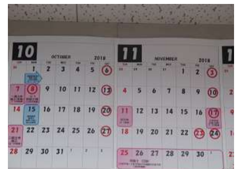
カレンダーに資格試験日

資格試験日は、はっきりわかるように大きなカレンダーに書かれています。また血圧計と体温計が事務所におかれ、気になった時、測定できるようになっています。