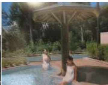
露天風呂(パンフレットより)