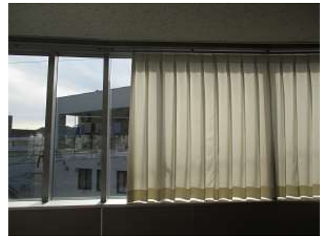
遮熱・防煙カーテン