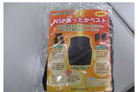
ヒーター付きベスト